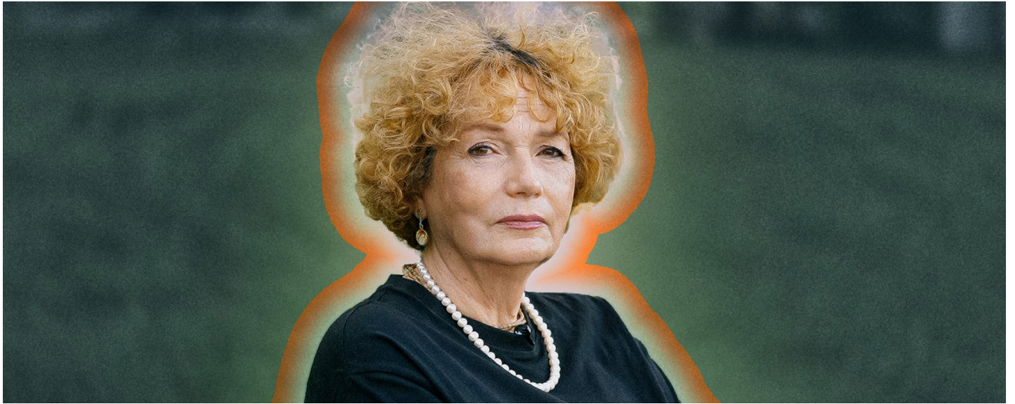
Фото: Наталья Холманова, SOTAvision / Коллаж: ОВД-Инфо

11.06.2025, 18:03 Калининградская область