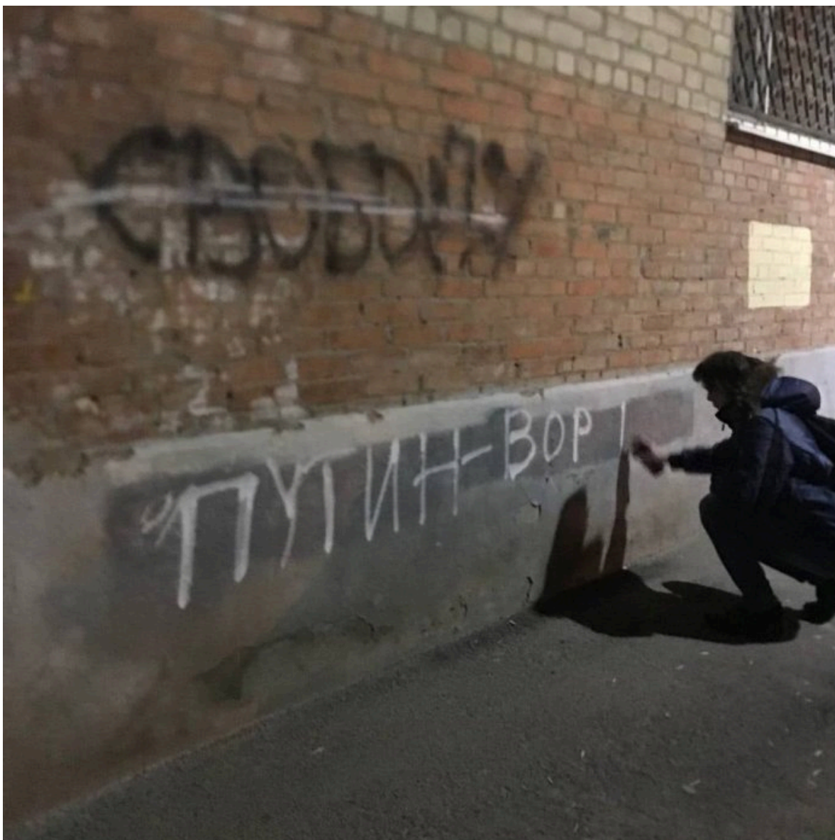
Фото граффити, сделанное Вероникой Горецкой