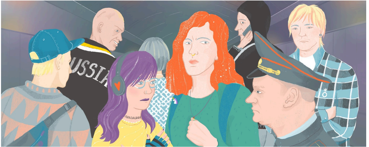
Иллюстрация: Марина Маргарина для ОВД-Инфо