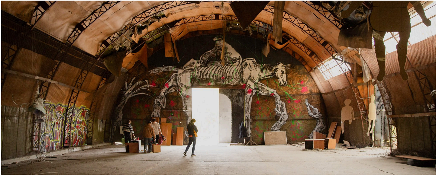
Выставка «Энтропия» сообщества ZABROSHKA в Екатеринбурге, 21 сентября 2024 года