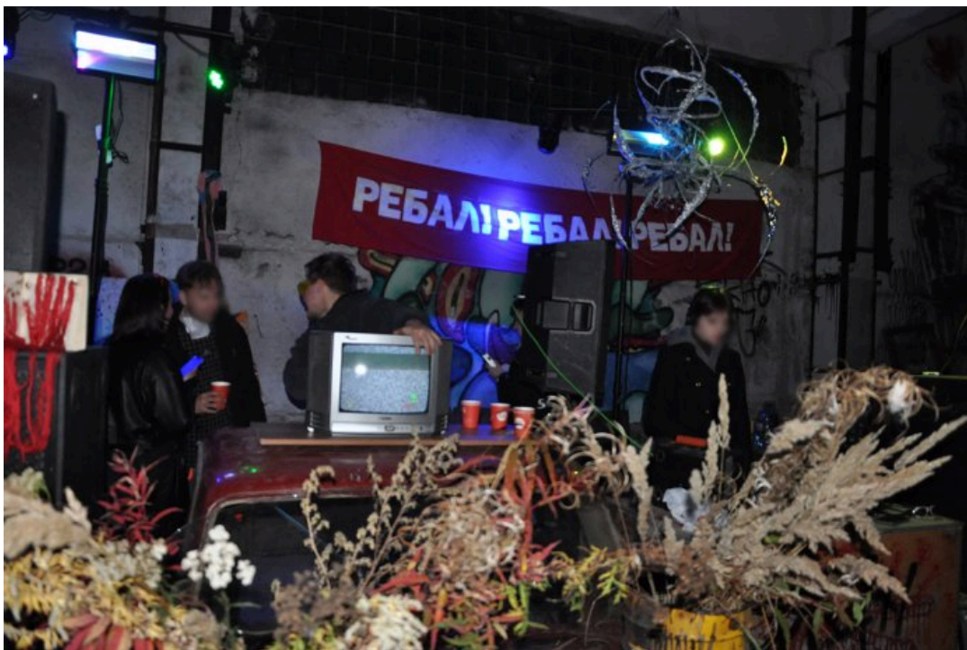
Вечеринка сообщества Ребал, 21 сентября 2024 года

Корреспондентка ОВД-Инфо обратилась за комментарием к сообществу Ребал, но участники команды отказались говорить, сославшись на анонимный концепт мероприятия. Позднее на связь с ОВД-Инфо вышел человек, назвавшийся пресс-секретарем Ребал, который согласился рассказать о том, что случилось на вечеринке тем вечером, не называя своего имени — «из соображений личной безопасности»: