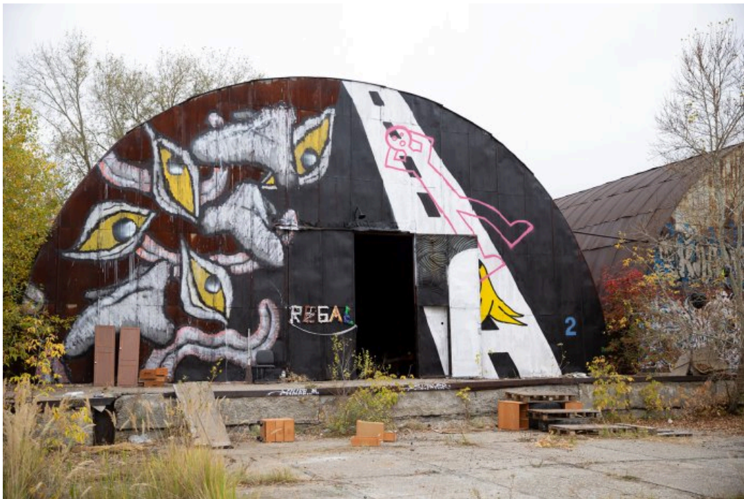
Ангар, в котором проходила выставка «Энтропия», 21 сентября 2024 года

«Место находится рядом с тем, где проходила предыдущая „Заброшка“, — продолжает он. — Художники не любят однообразие, люди хотели новое место. [В этот раз] у полиции был посыл, что тут опасный район, бывают наркоманы и драки, но две предыдущие „Заброшки“ прошли без проблем. Хотя первая была локальная и малюсенькая, ее и заметить сложно было, а вторая уже была здоровая и буквально в том же пространстве, просто через лесок».